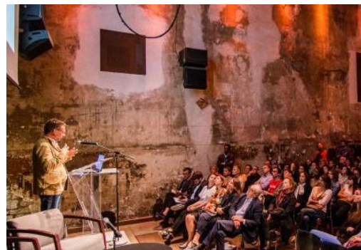
Images de la première saison du cycle Les Architectes du Grand Paris Express à la Maison de l'Architecture en Île-de-France