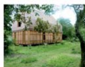
Maison de Veneux-Les-Sablons