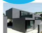
Maison à patios