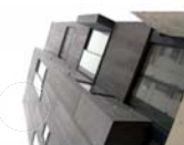
La maison du paysagiste