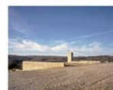
Maison individuelle à Séniergues