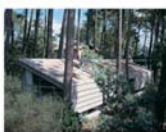
Maison du Lac