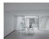
Réhabilitation d'un immeuble de bureau et de logement