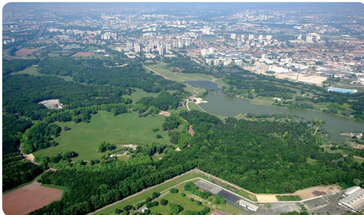
La Courneuve vue du ciel

Territoire prioritaire en matière d'aménagement, l'État et la Région se sont engagés pour son développement dans le contrat de projets.