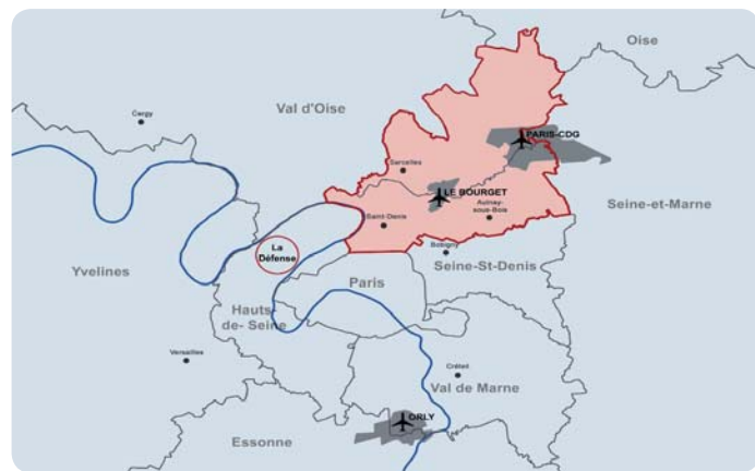
Situation de l'EPA Plaine de France en Île-de-France