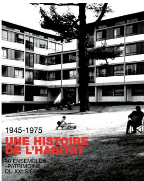
Publication - Editions Beaux-Arts