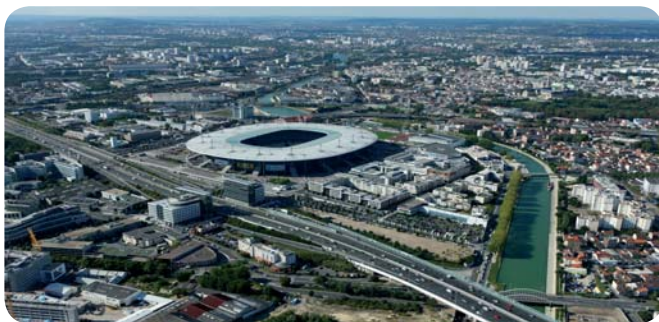
Le Stade France vu du ciel